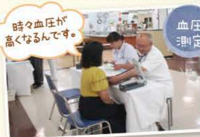
時々血圧が高くなるんです。