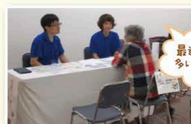
最近、物忘れが多い気がして・・・