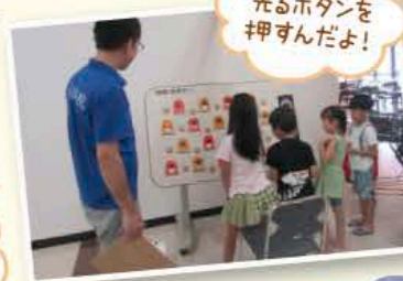
光るボタンを押すんだよ!

理学療法士による運動療法のアドバイス 子どももできるボードトレーナーで運動機能をチェック