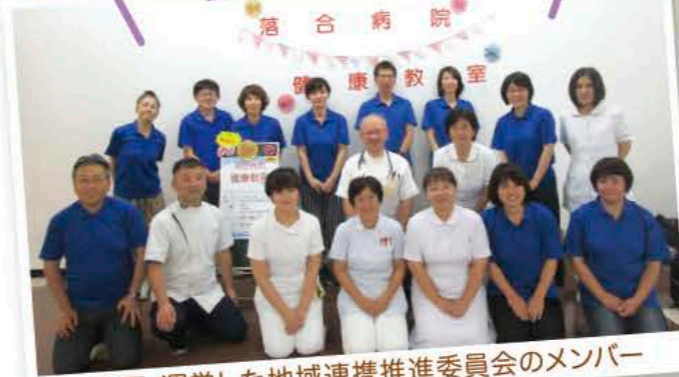
企画・運営した地域連携推進委員会のメンバー

ご来場の皆様、会場を提供していただいたマルイアルティ店の皆様、ありがとうございました。